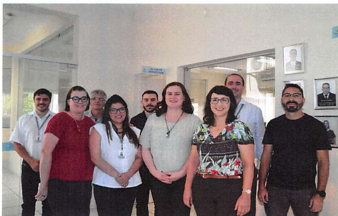
Figura 3 - Membros do Conselho Fiscal