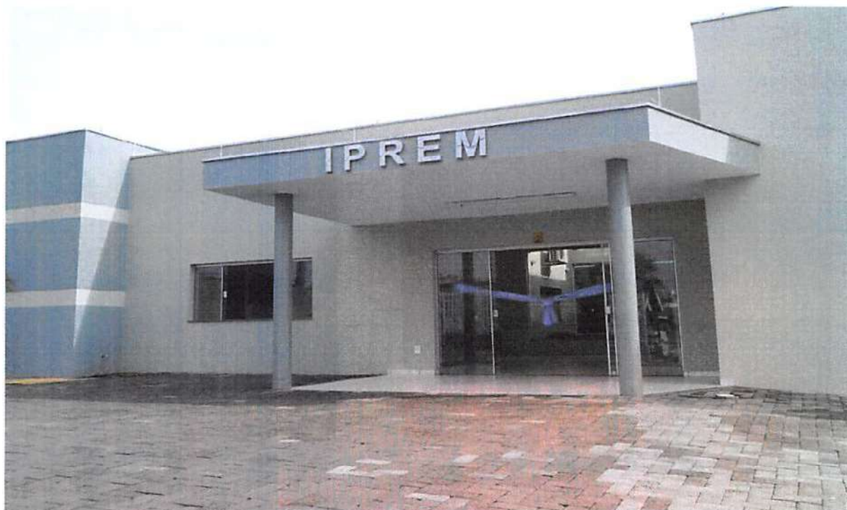
Figura 1 - Sede do IPREM