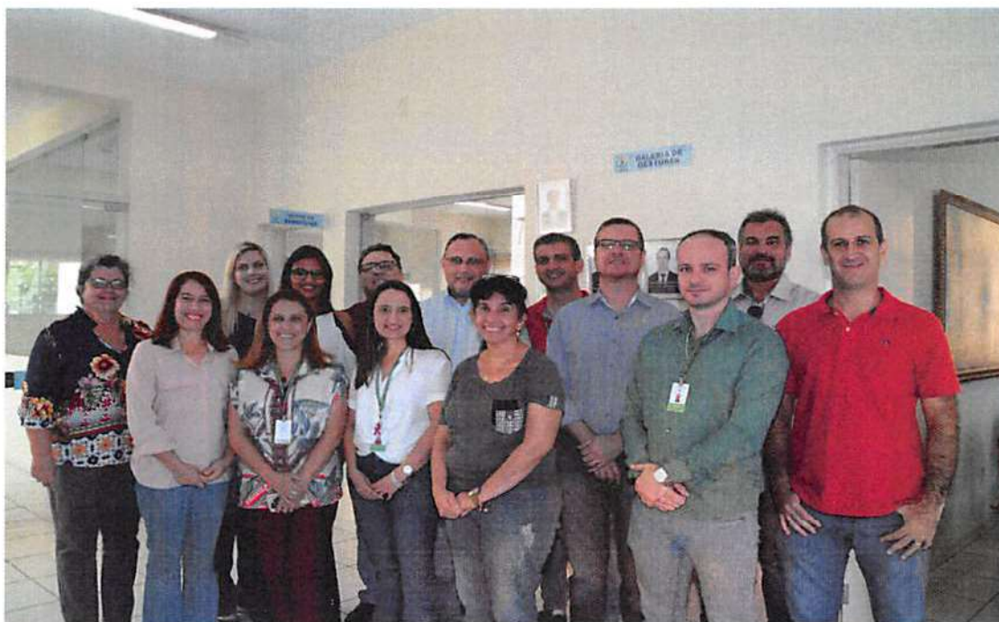
Figura 2 - Membros do Conselho Administrativo

A handwritten signature in blue ink, located in the bottom right corner of the page. The signature is stylized and appears to be a name, possibly "M. Silva".